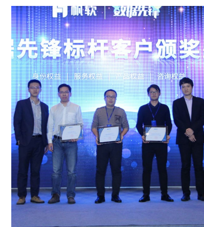
数据先锋颁奖现场照片